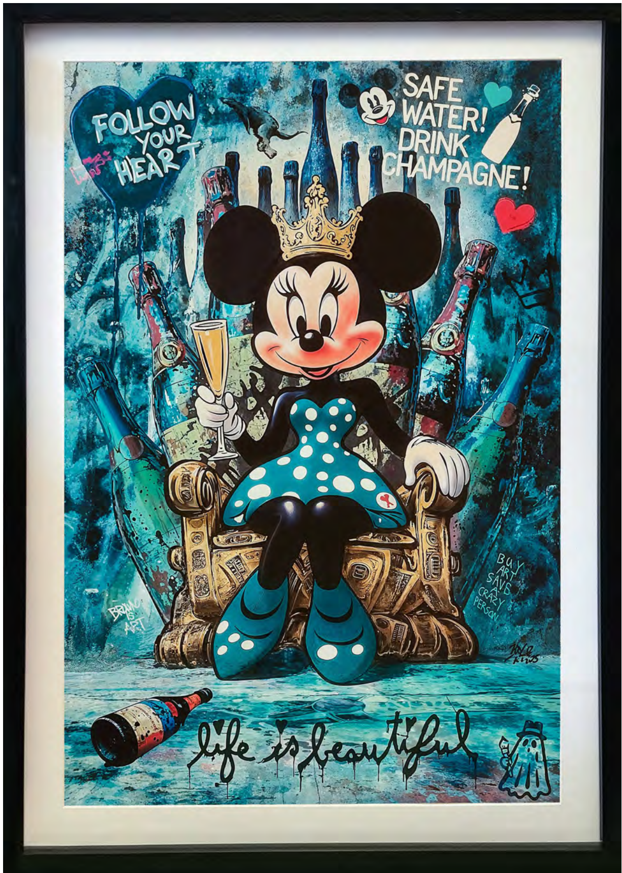
CHAMPAGNE QUEEN Series: THE LUXURY ICONS CLUB