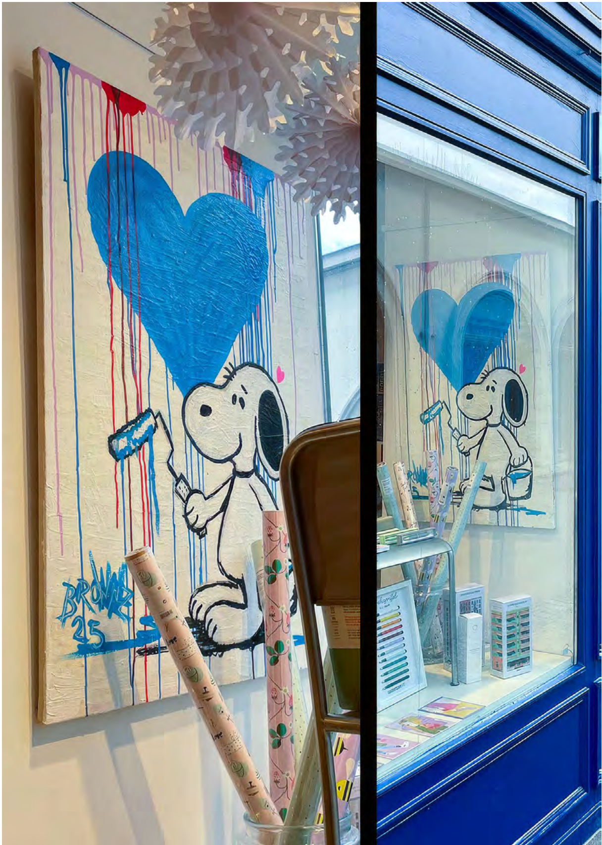
BLUE HEART PAINTER Series: THE RAW ORIGINALS