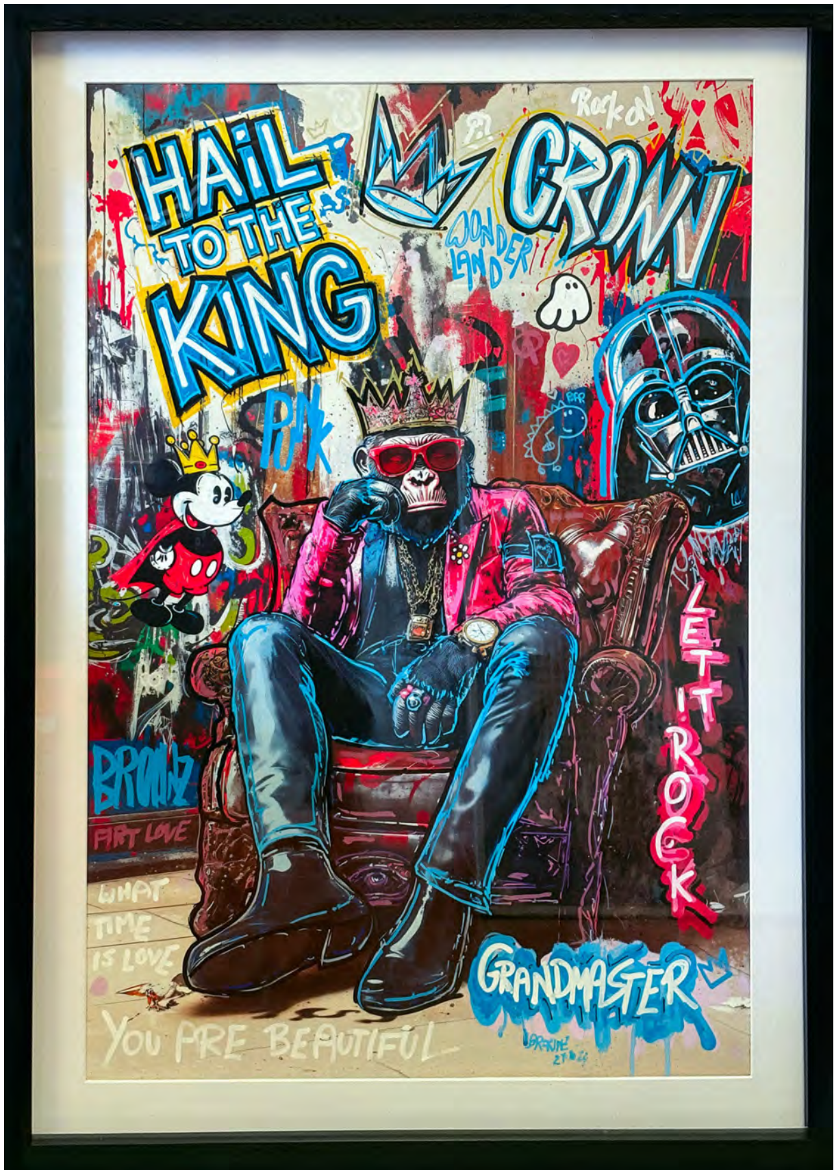
GRANDMASTER Series: THE ROYAL APE SOCIETY