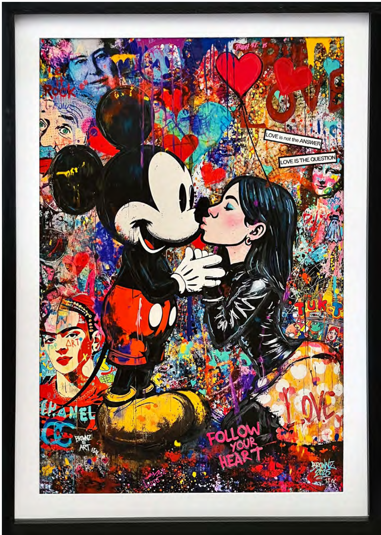
THE KISS Series: THE POP HEART THEORY