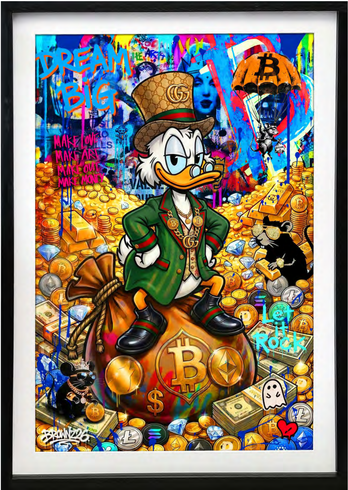
DREAM BIG — CRYPTO DUCK Series: THE DIGITAL GOLD CLUB