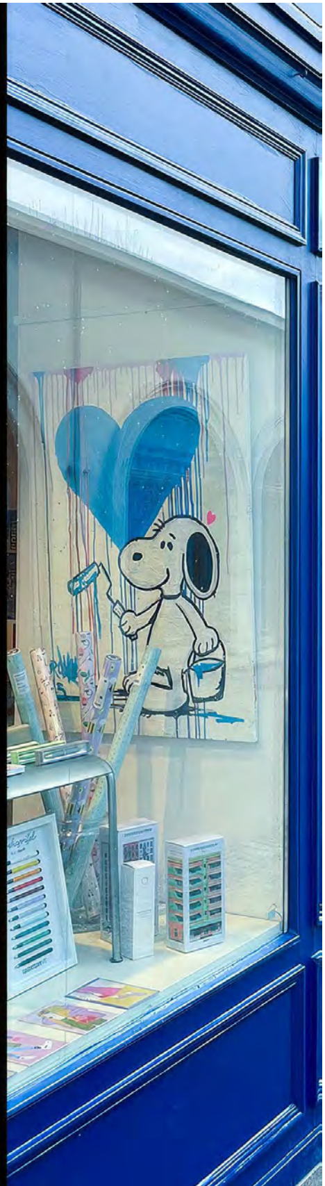
BLUE HEART PAINTER Series: THE RAW ORIGINALS