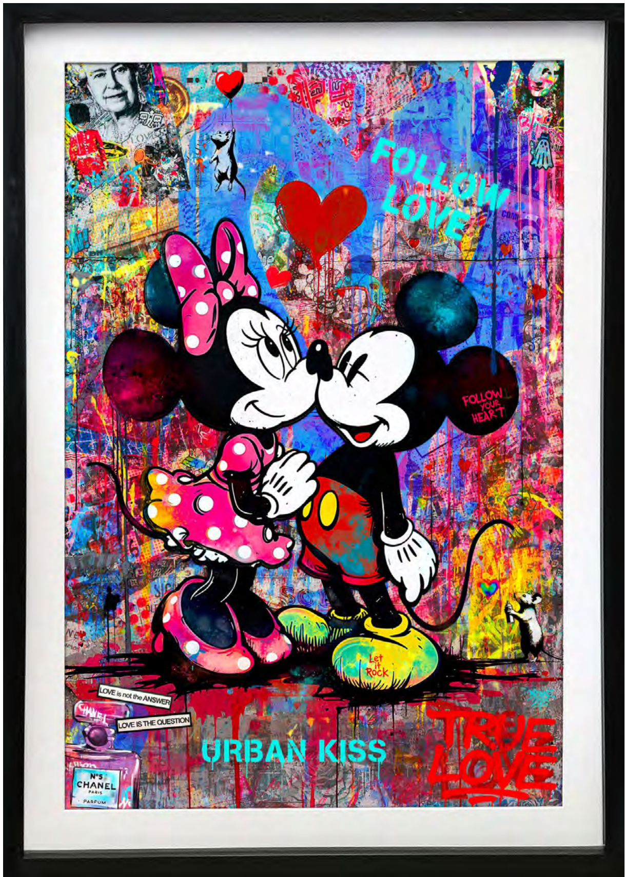
URBAN KISS Series: THE BLUE HEART ECONOMY