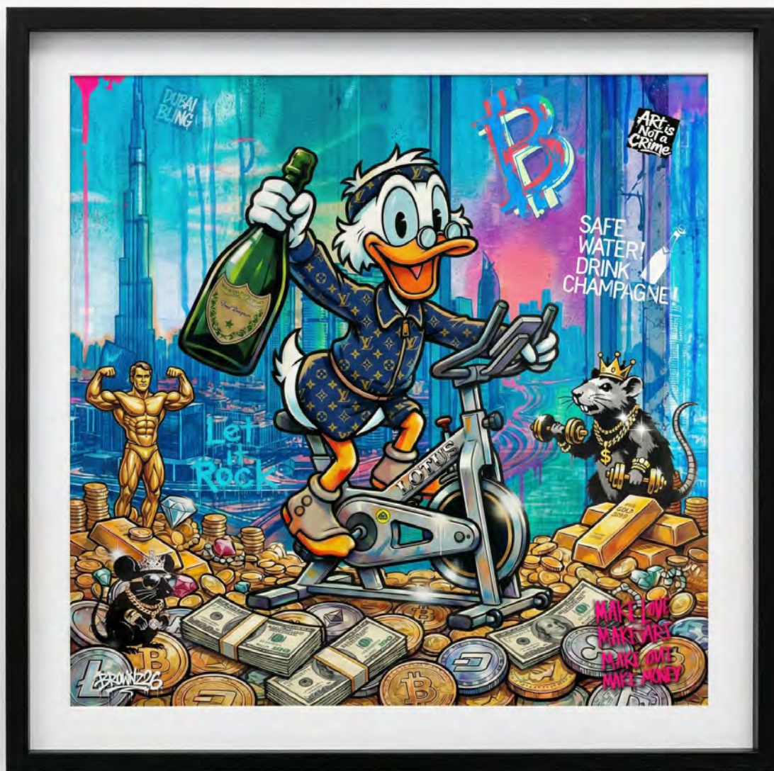
FIT-O-BERT — LOTUS EDITION Series: THE DIGITAL GOLD CLUB