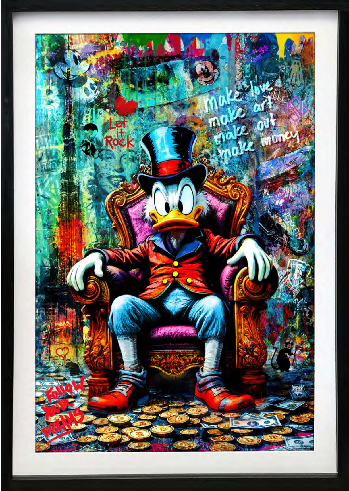
DUBAI BLING — CRYPTO DUCK Series: THE DIGITAL GOLD CLUB