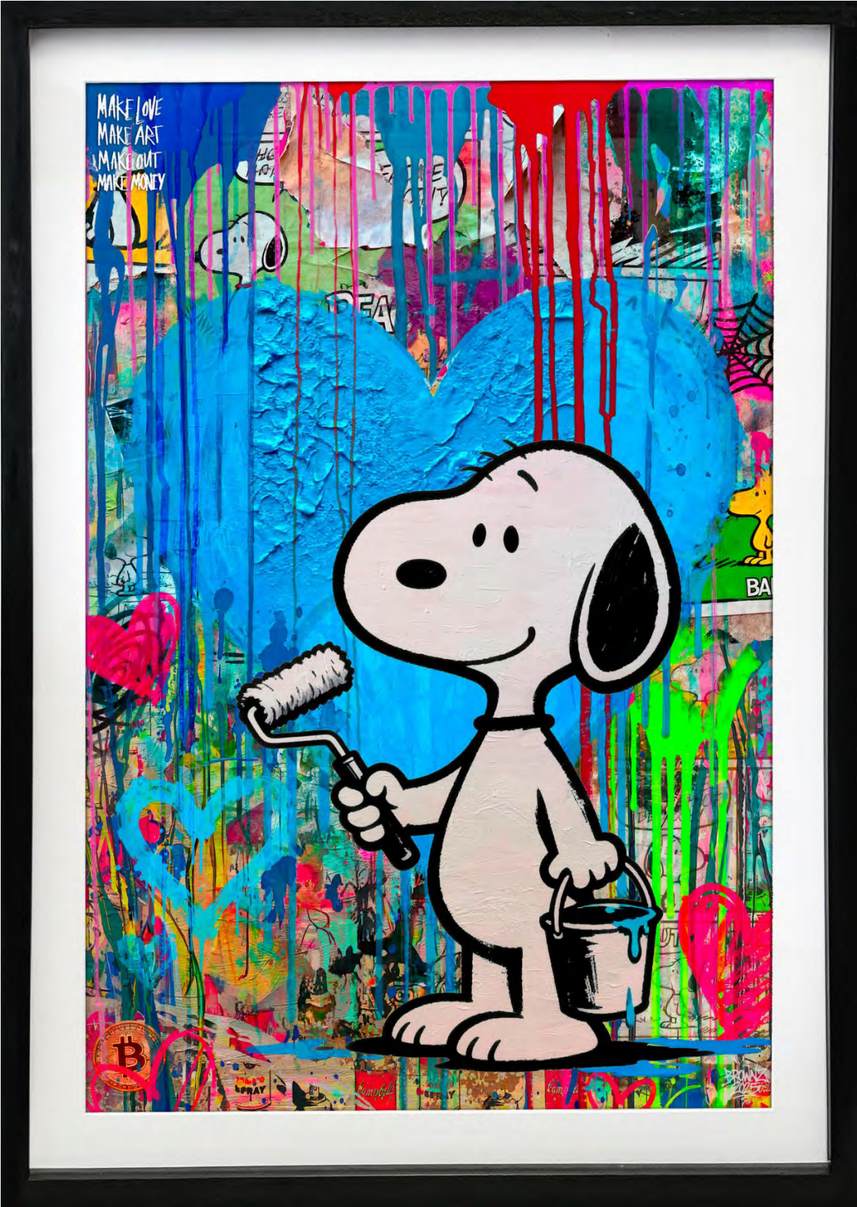
URBAN HEART — SNOOPY PAINTS LOVE Series: THE BLUE HEART ECONOMY