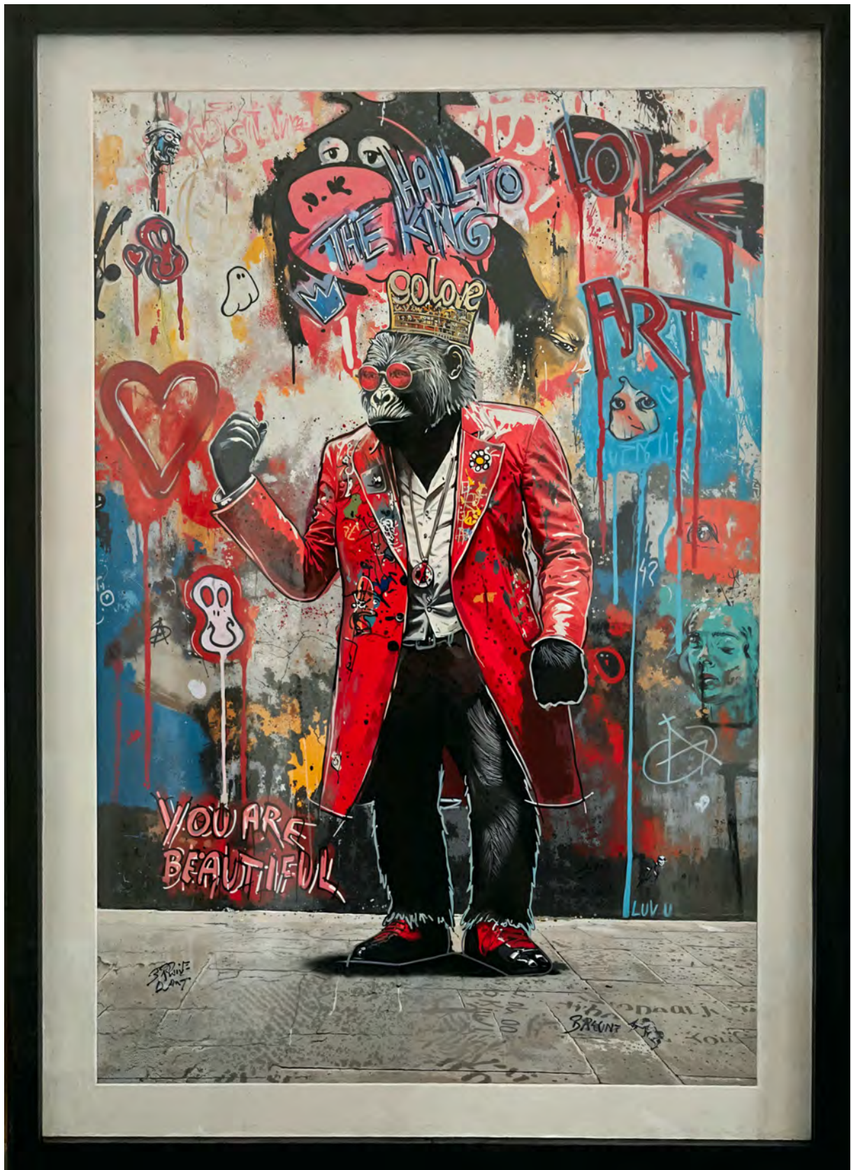
GO LOVE Series: THE ROYAL APE SOCIETY