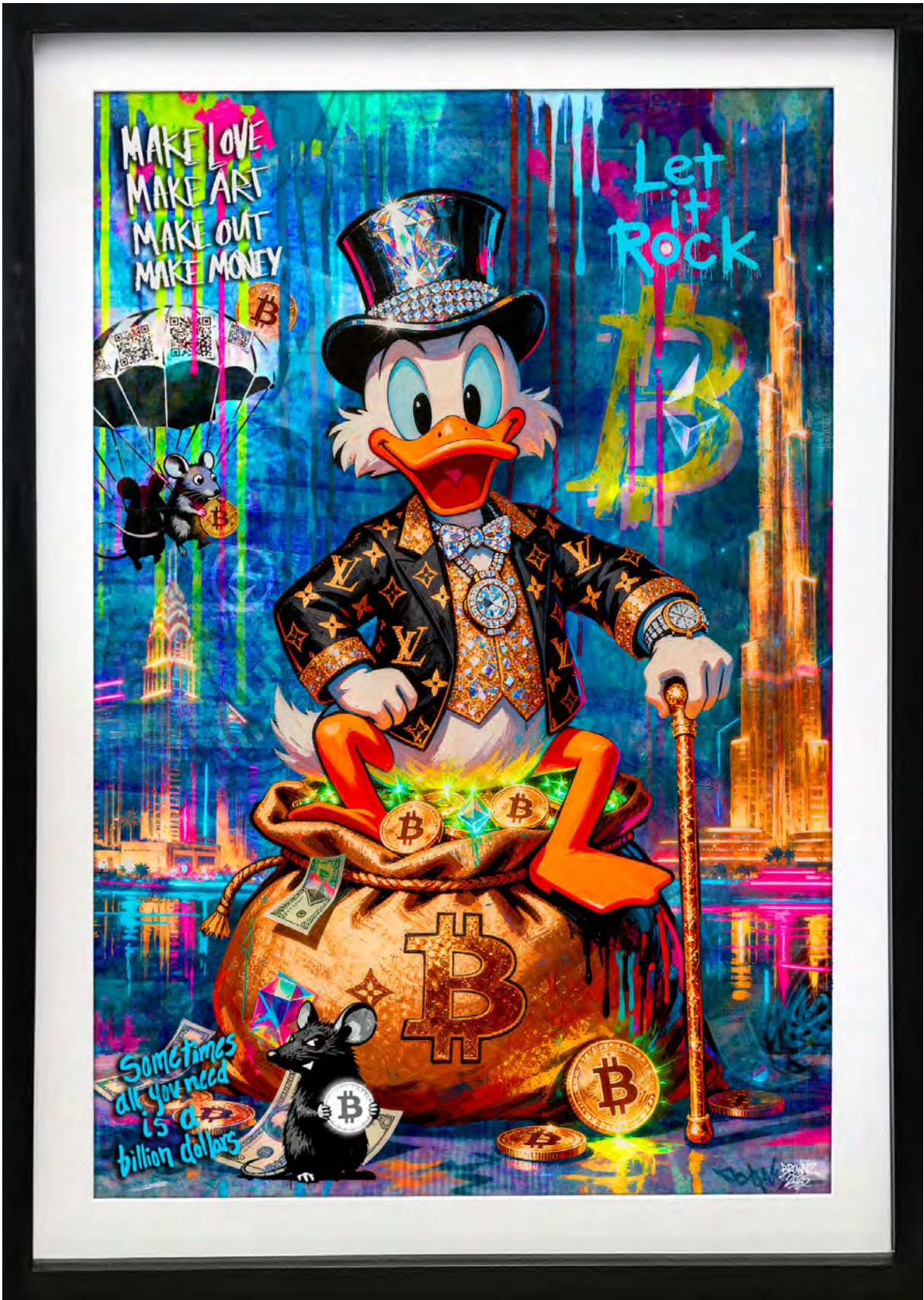
DUBAI BILLION DUCK Series: THE DIGITAL GOLD CLUB