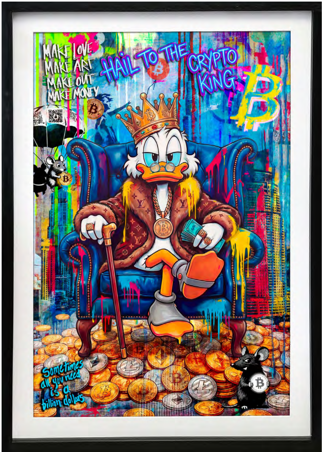
HAIL TO THE CRYPTO KING Series: THE DIGITAL GOLD CLUB