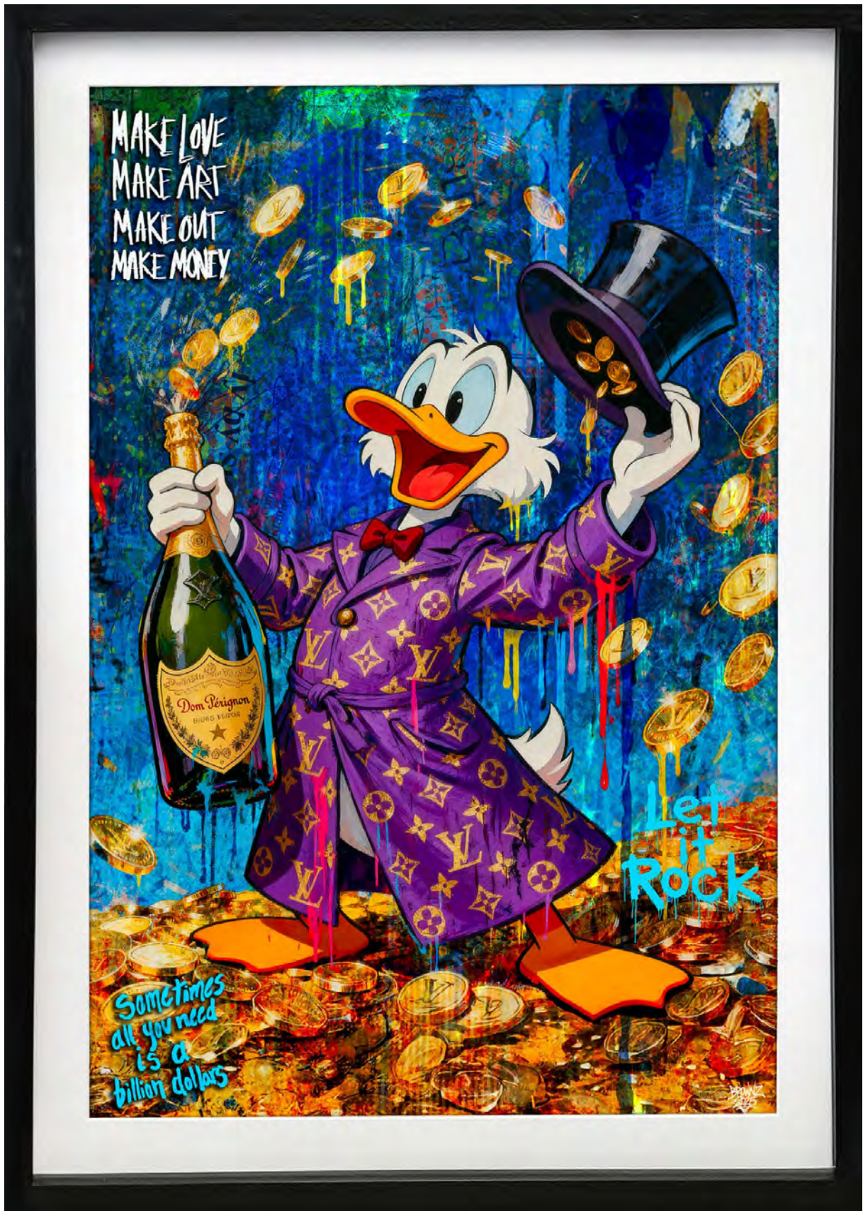
BILLION DOLLAR DUCK Series: THE DIGITAL GOLD CLUB