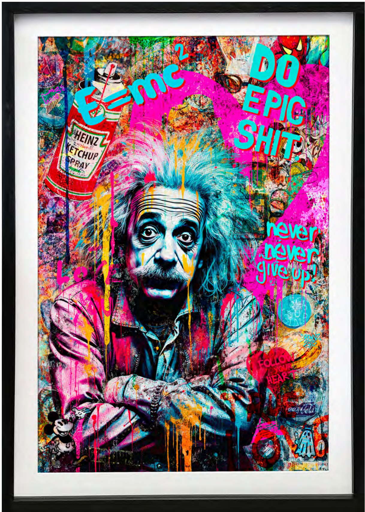
DO EPIC SHIT Series: THE POP HEART THEORY