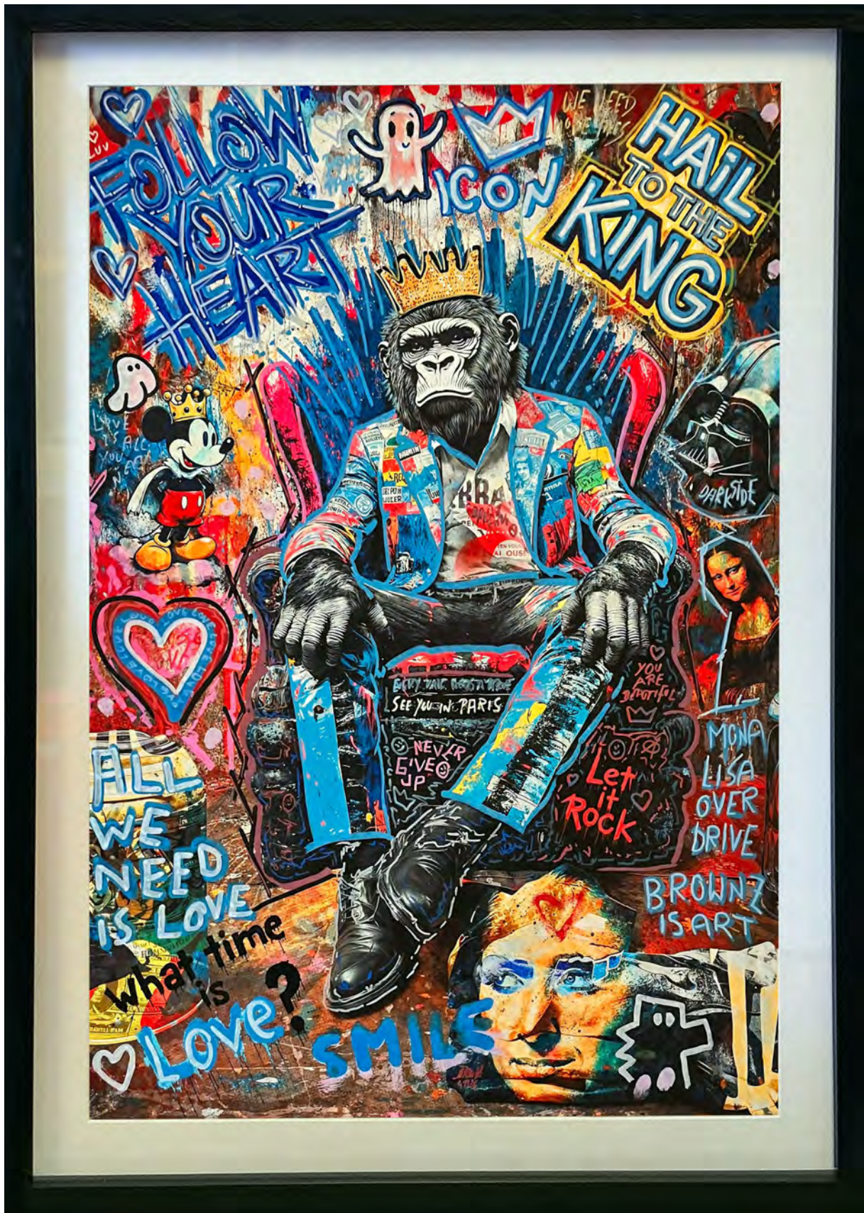
SUPERFUNKY Series: THE ROYAL APE SOCIETY