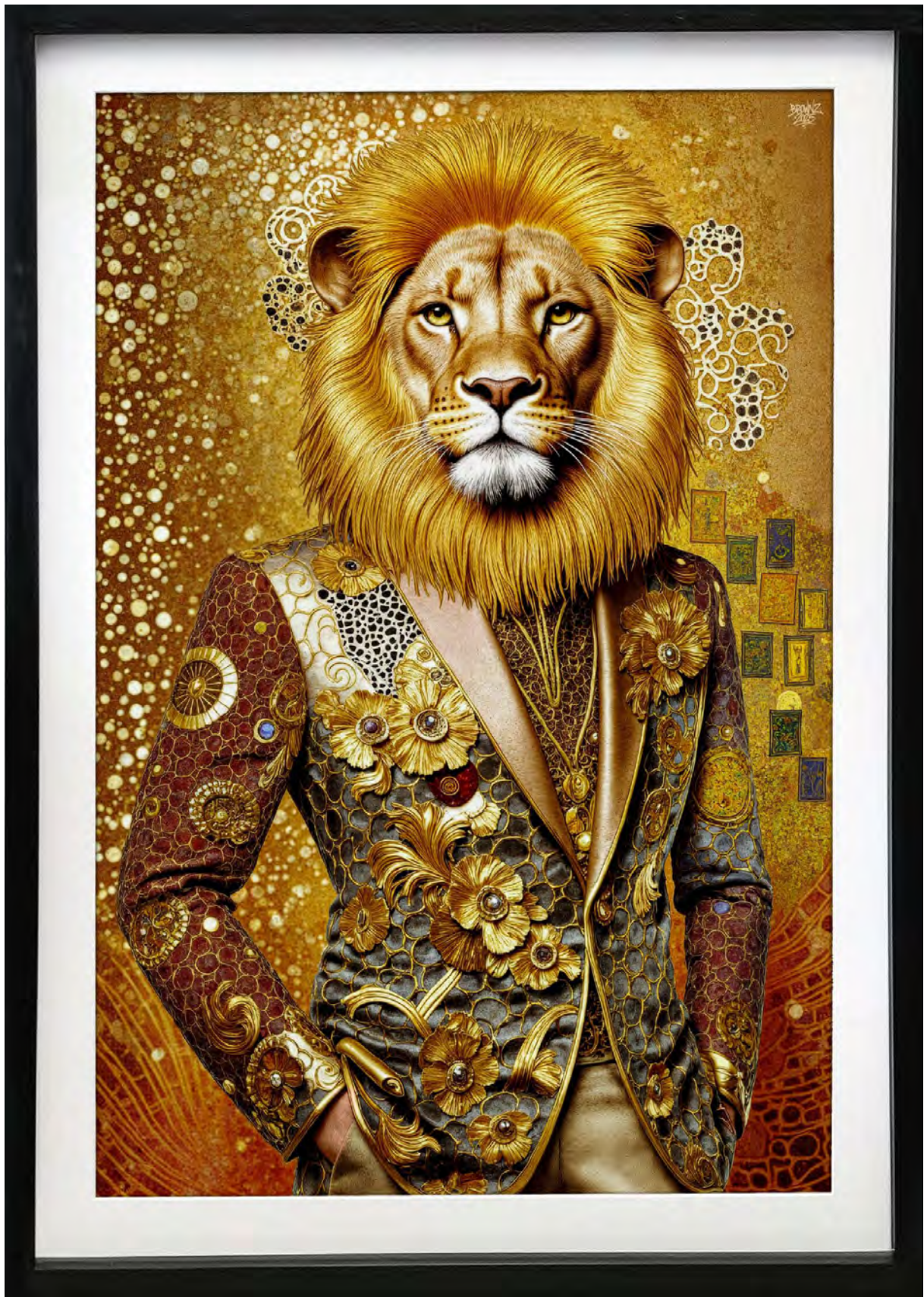
GOLDEN LION Series: THE COMMISSIONED VISIONS