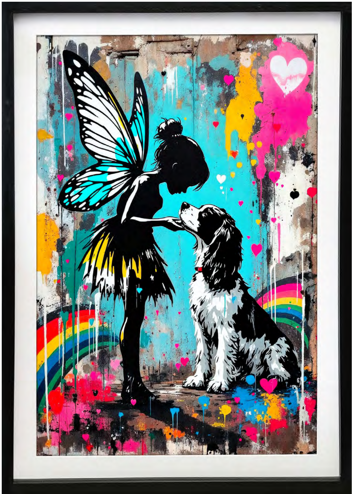
BOOGIE & TINKERBELL Series: THE COMMISSIONED VISIONS