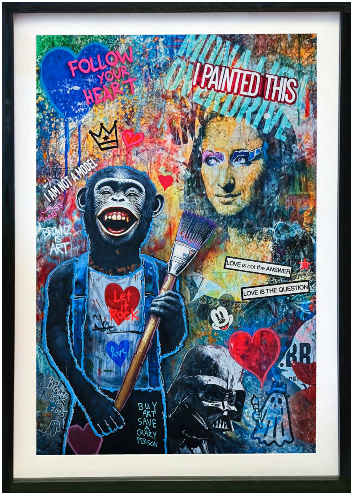
I PAINTED THIS Series: THE ROYAL APE SOCIETY