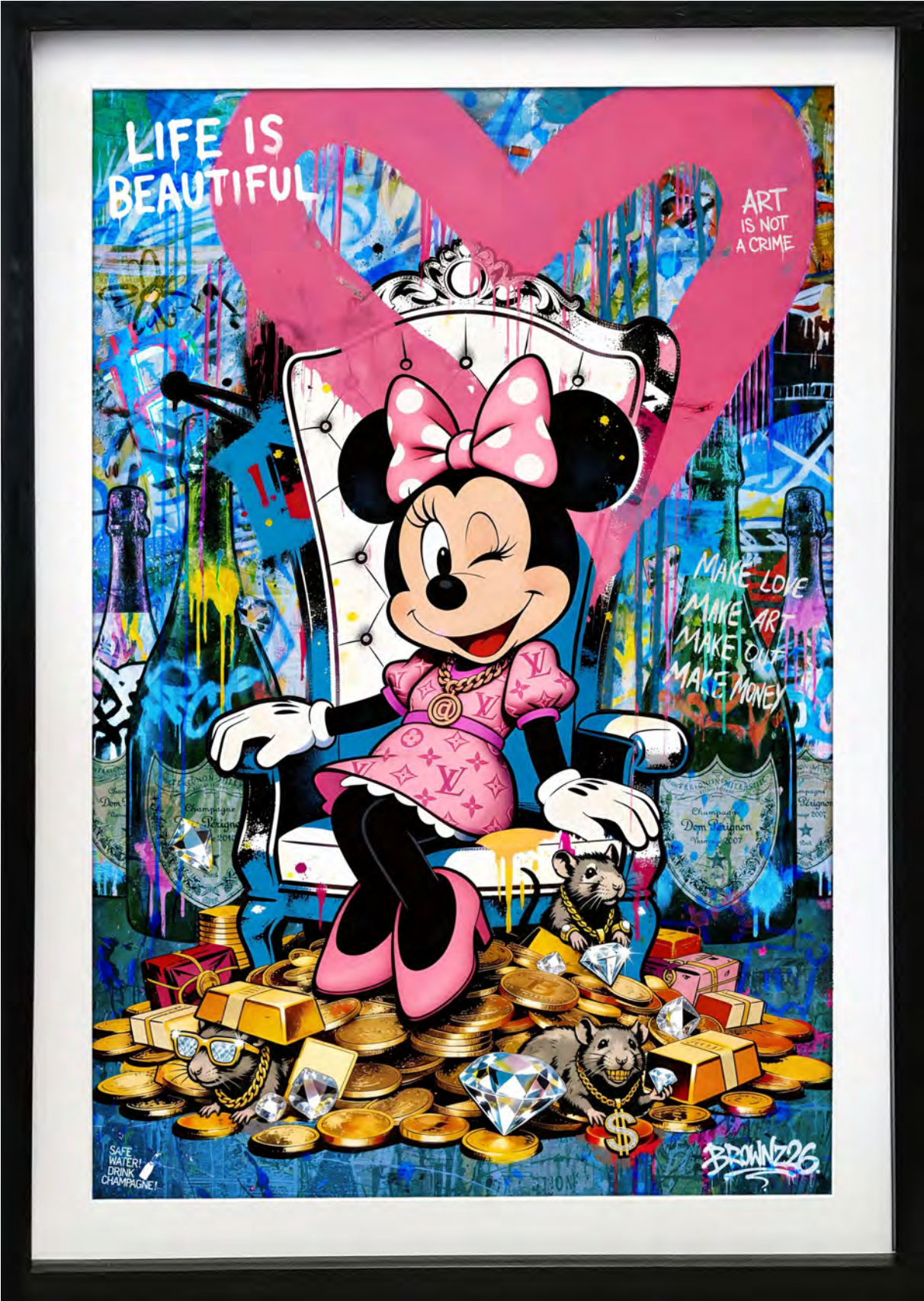
PINK IS THE NEW GOLD - June Drop 2026 Series: THE LUXURY ICONS CLUB