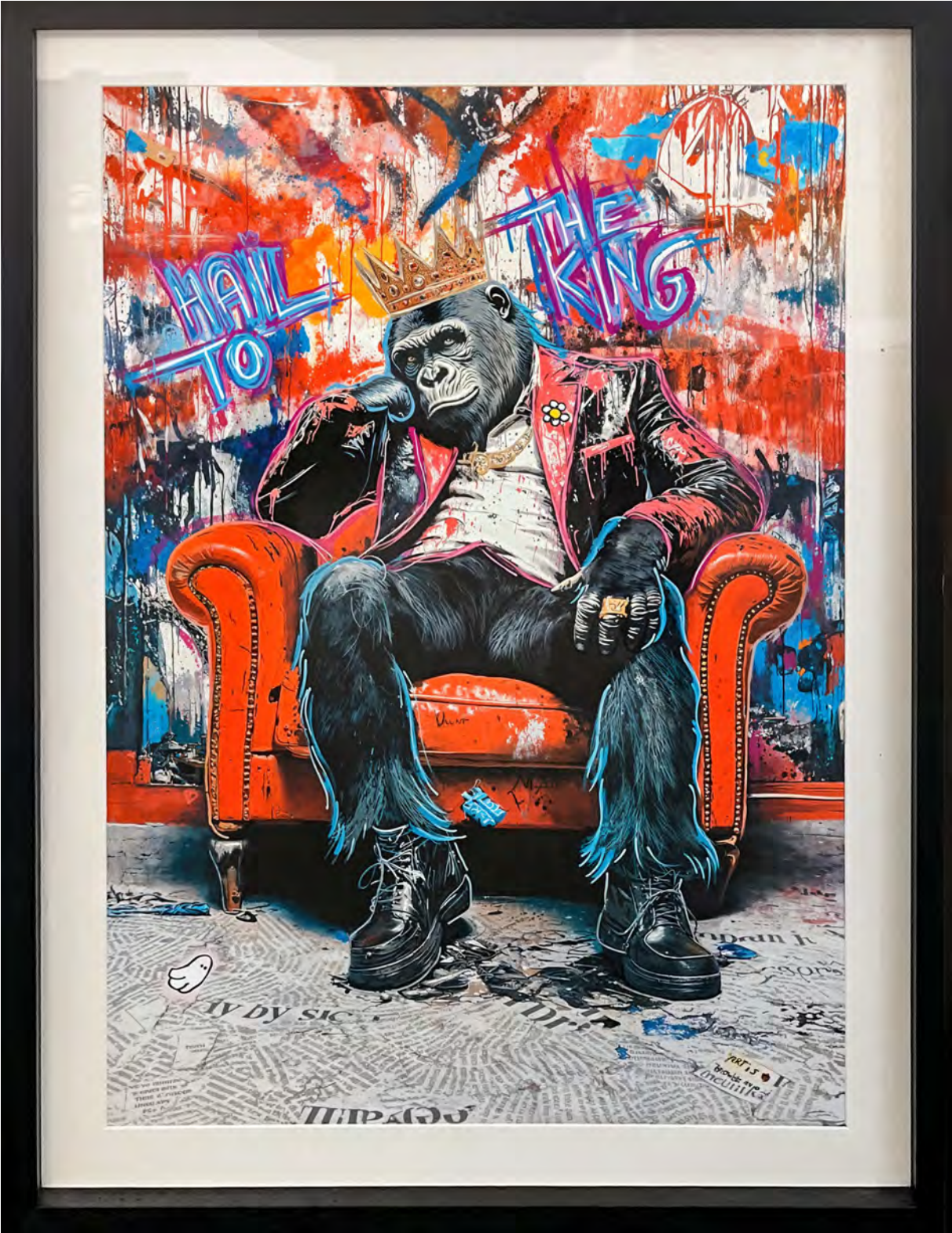
HAIL TO THE KING From the series: THE ROYAL APE SOCIETY