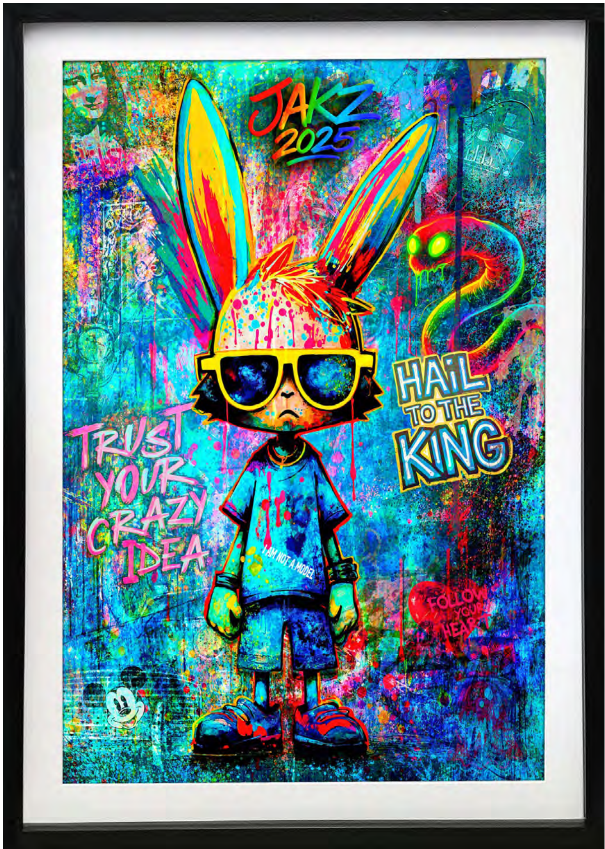
TRUST YOUR CRAZY IDEA Series: THE COMMISSIONED VISIONS