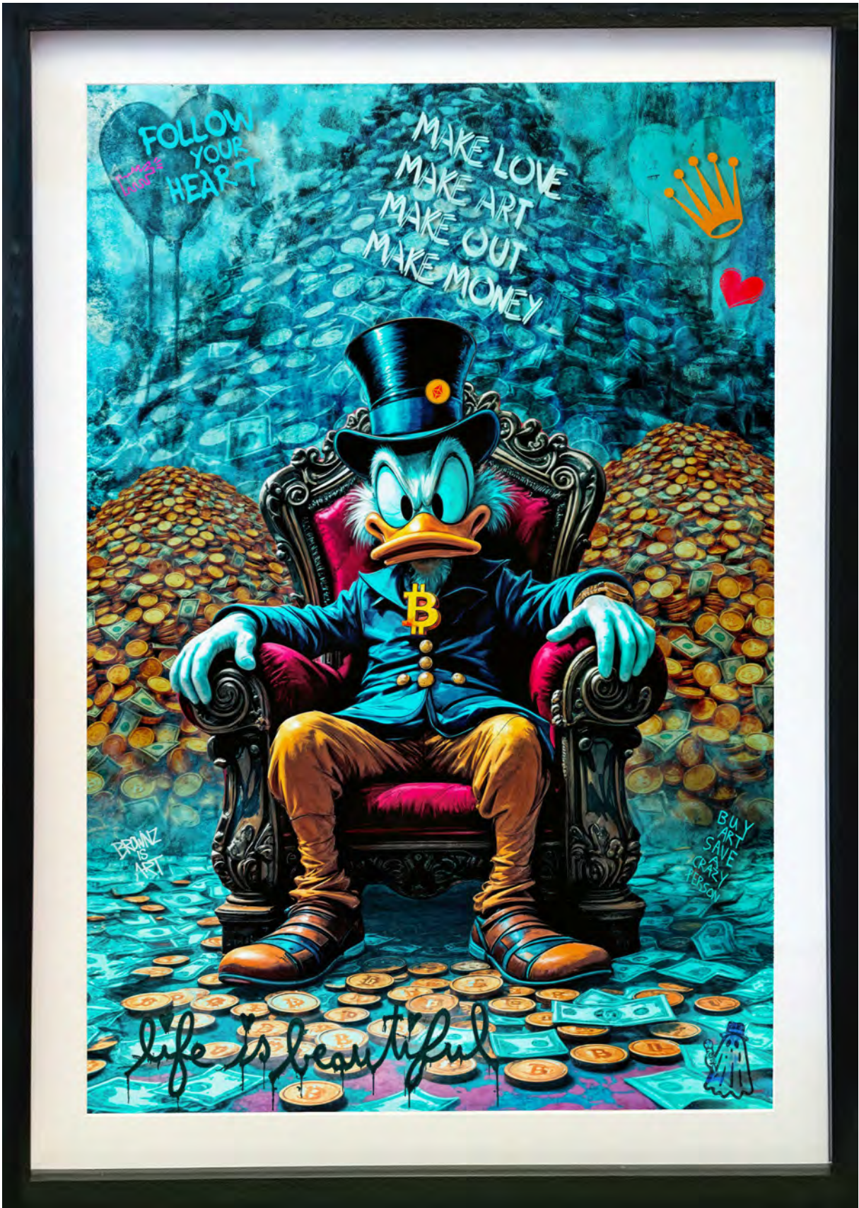
MONEY KING Series: THE LUXURY ICONS CLUB