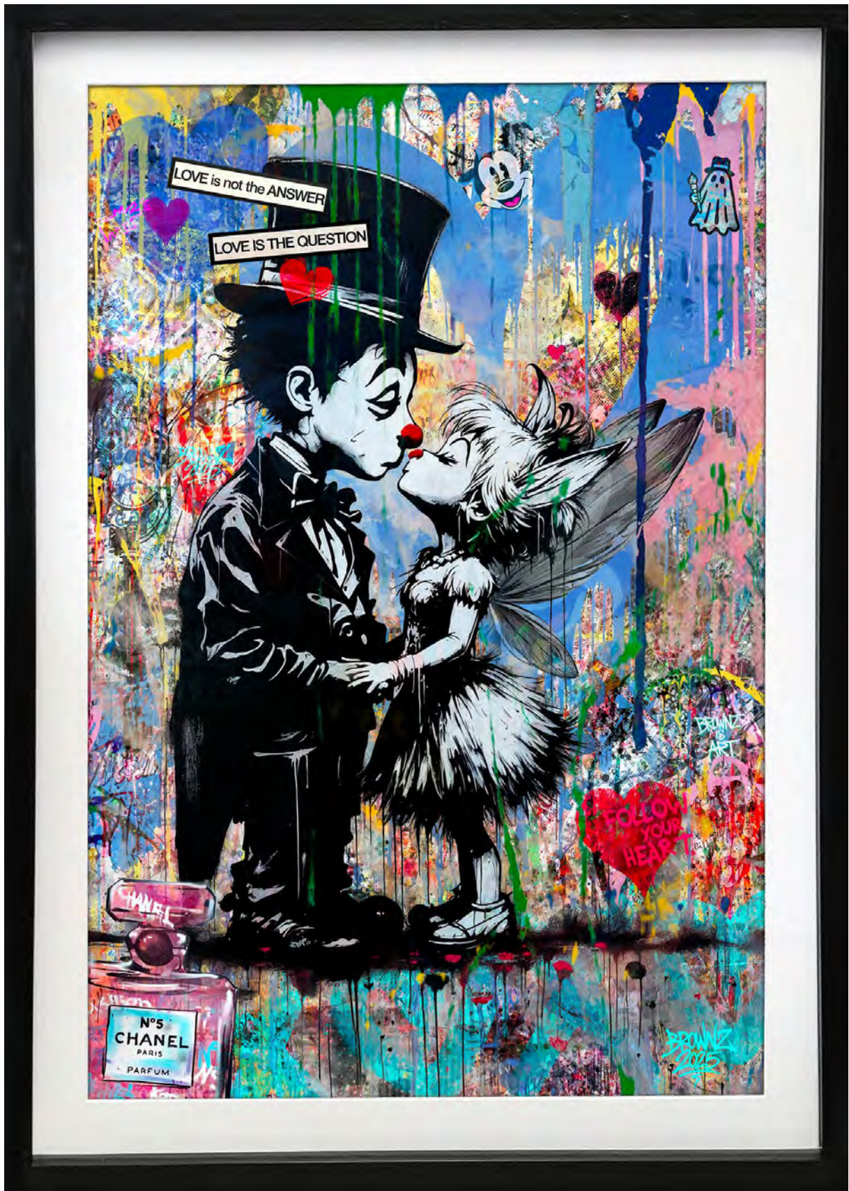
TINKER N°5 Series: THE BLUE HEART ECONOMY